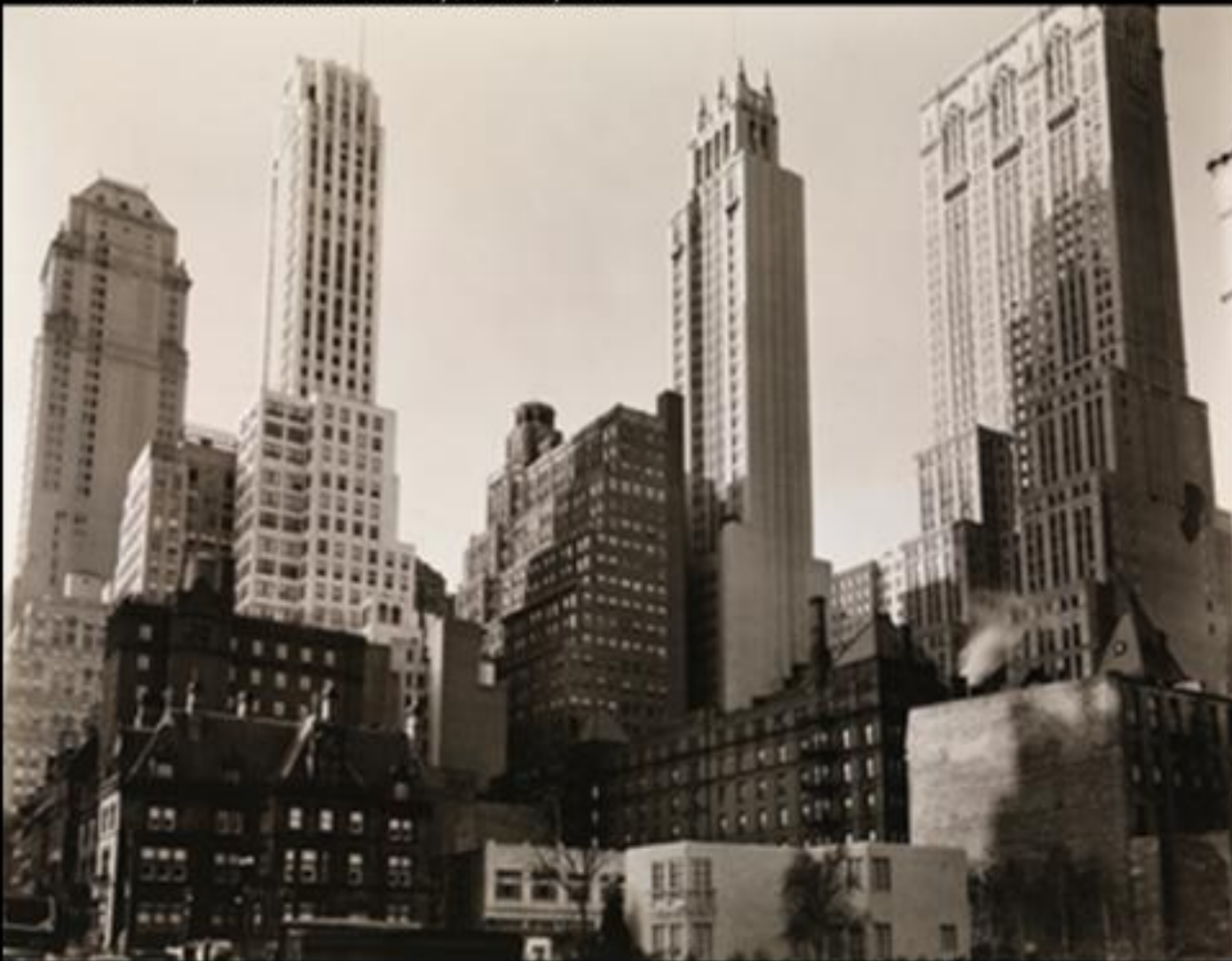
Berenice Abbot, Park Avenue et 39 e rue, New-York, 1936